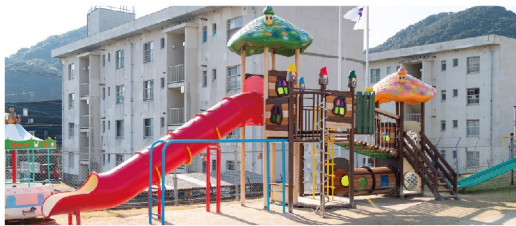
● 広い運動場、たくさんの遊びを工夫します